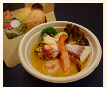
◎オマール海老と海の幸の ブイヤベーススープセット