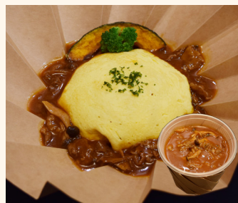
◎オリーブ牛のオムハヤシライス