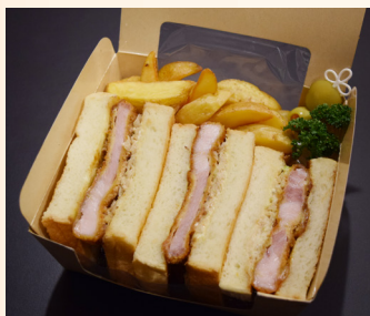
◎オリーブ豚口ースカツサンド

柔らかくジューシーな牛フィレにはトリュフが香るソースをかけて。濃厚なフォアグラとともにどうぞ。