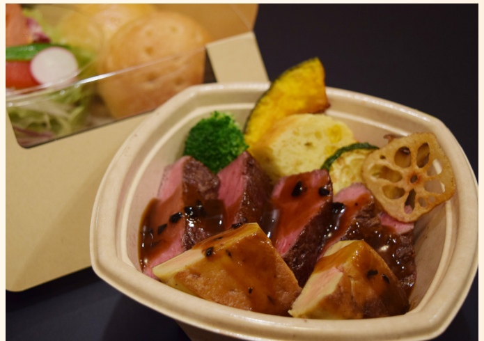
◎牛フィレとフォアグラのソテーロッシェニ風セット

サラダやお肉、お魚、フルーツまで。バランスの取れたランチBOX! ご飯はヘルシーに雑穀米を使用。