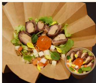
◎オリーブ牛とフォアグラのスケール丼